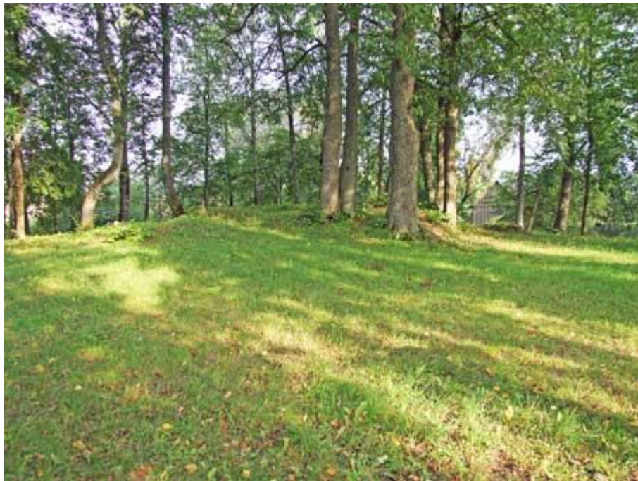
1561 m. šioje vietoje jau stovėjo kunigaikščių Radvilų pilis.